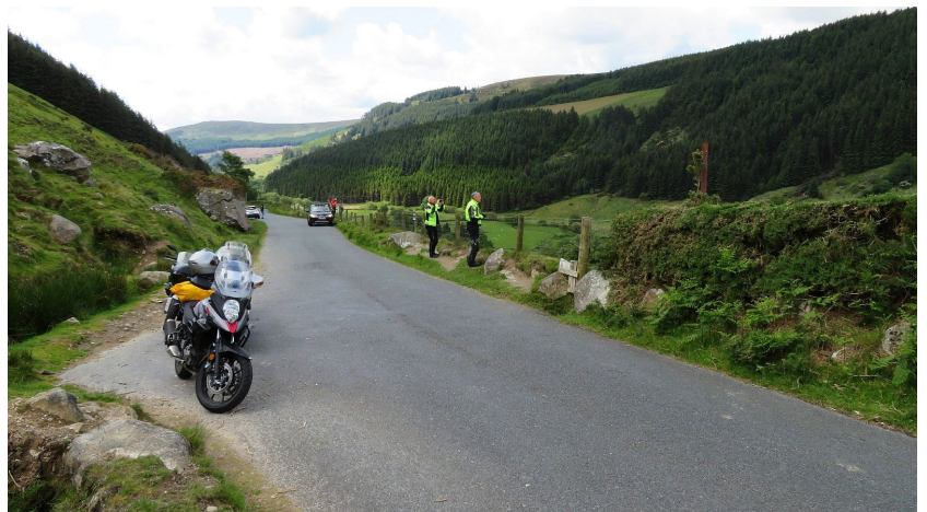
Natuurgebied in County Wicklow

Na de overnachting ging het noordwaarts naar een schitterend natuurgebied in County Wicklow, ten zuiden van Dublin.