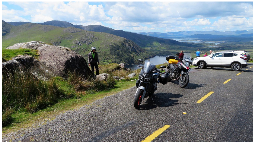
Mooi motorrijden in Ierland

De uitgezette routes in Ierland namen wat meer tijd in beslag dan gepland. De meeste wegen in Ierland hebben een maximumsnelheid van 80 of 100 km/uur, en deze snelheid is absoluut niet haalbaar. Hierdoor is de navigatie qua tijd niet erg accuraat. Voor ons was dit overigens geen reden om de routes in te korten.