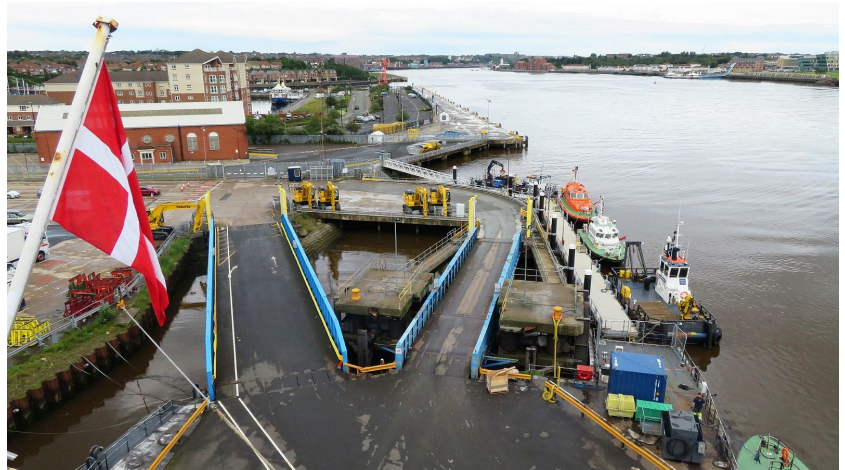
Vertrek uit Newcastle

De boot, die van Newcastle naar IJmuiden vaart, begint wel erg geda-teerd te raken. Veel herrie en trillingen, kleine ouderwetse kamers. Na zo'n 16 uur werd de haven van IJmuiden bereikt en moest de laatste twintig minuten naar huis worden gereden door de regen.