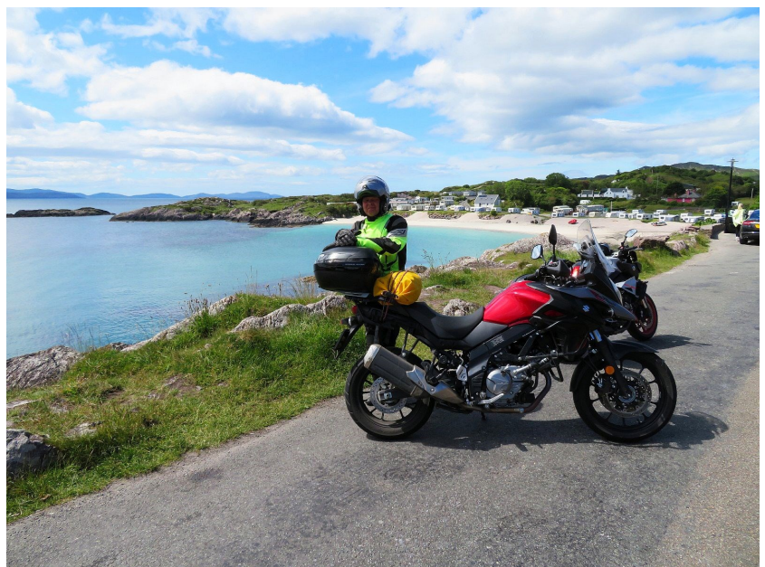
Mooie kusten, ook met stranden

De route begon voor ons in Normandië, maar het is natuurlijk ook mogelijk om deze routes te rijden vanuit Nederland. Vanuit Nederland naar Calais rijden en dan met de motor de trein door de tunnel nemen. Het plaatsje Andover in Engeland is dan een prima plek voor een overnachting. Een route van Folkstone naar Andover is te vinden op deze website. Dan rechtstreeks naar Fishguard voor de oversteek naar Ierland.