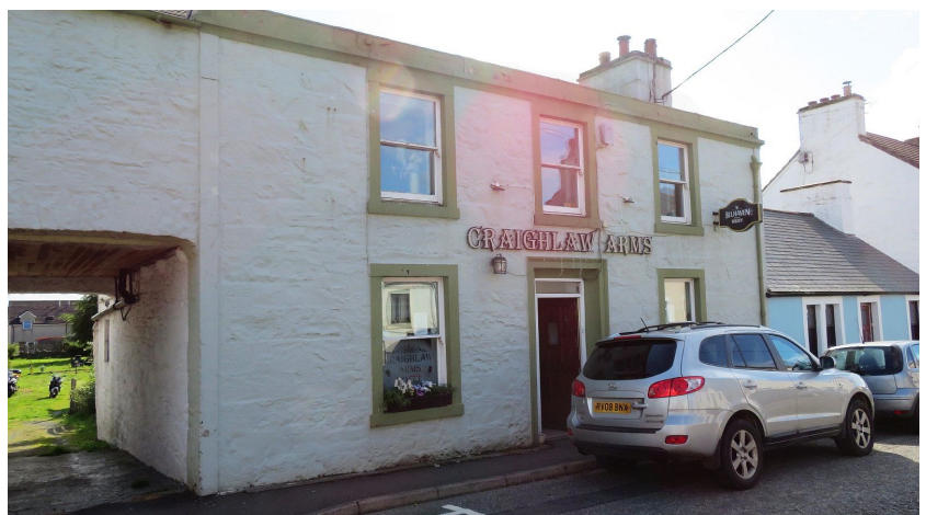
Craighlaw Arms Hotel in Kirkowan