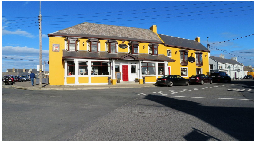
Bay View hotel

Voor het laatste deel van de rit werd een kronkelroute uitgezet naar Newcastle. Ook hier een aantal (te) smalle weggetjes, maar toch een prima route. Toen de TomTom begon te