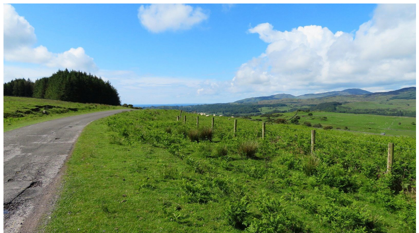
De kronkelroute naar Enniskillen