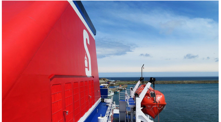
De ferry naar Rosslare

Dus werd besloten om de boot vanuit Ouistreham naar Portsmouth te nemen en dan door te rijden naar Cardiff voor een overnachting. Tijdens de rit van Caen naar Ouistreham regende het pijpenstelen en dat was de laatste regen die we hebben gezien in Engeland, Ierland en Schotland. De volgende dag werd koers gezet naar het plaatsje Fishguard, om de ferry naar Rosslare in Ierland te nemen.