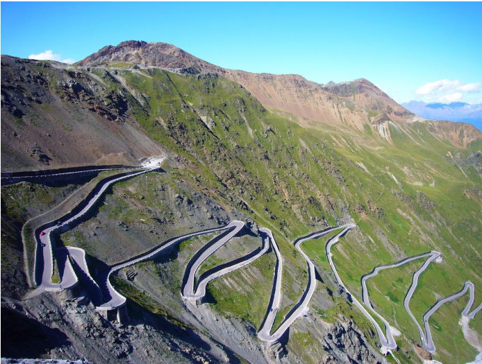
Stelvio - leuke pas op de heenweg